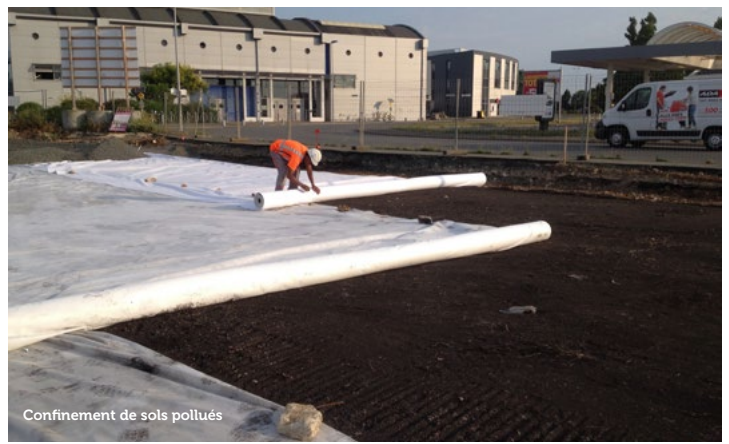
Confinement de sols pollués

LA MAÎTRISE DES COÛTS ET DES RISQUES EST AU CŒUR DE NOS SOLUTIONS.