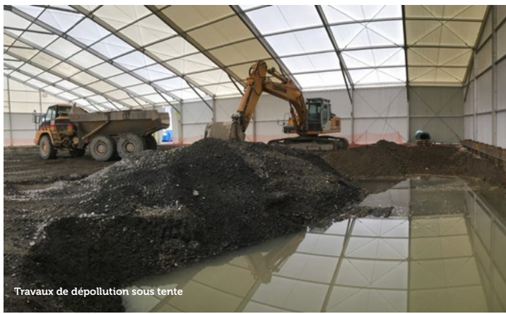
Travaux de dépollution sous tente