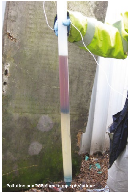
Pollution aux PCB d'une nappe phréatique