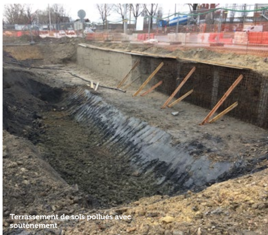
Terrassement de sols pollués avec soutènement

LA MAÎTRISE DES COÛTS ET DES RISQUES EST AU CŒUR DE NOS SOLUTIONS.