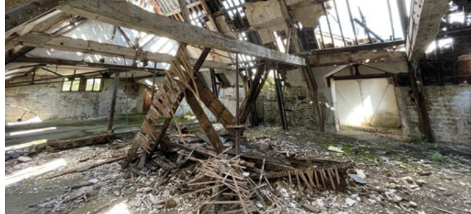
Friche de la filature Oudin, La-Ferté-sur-Chiers (08)

« Tout bien ou droit immobilier, bâti ou non bâti, inutilisé et dont l'état, la configuration, l'occupation totale ou partielle ne permet pas un réemploi sans un aménagement ou des travaux préalables ».