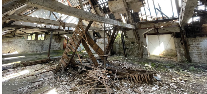
Friche de la filature Oudin, La-Ferté-sur-Chiers (08)

« Tout bien ou droit immobilier, bâti ou non bâti, inutilisé et dont l'état, la configuration, l'occupation totale ou partielle ne permet pas un réemploi sans un aménagement ou des travaux préalables ».