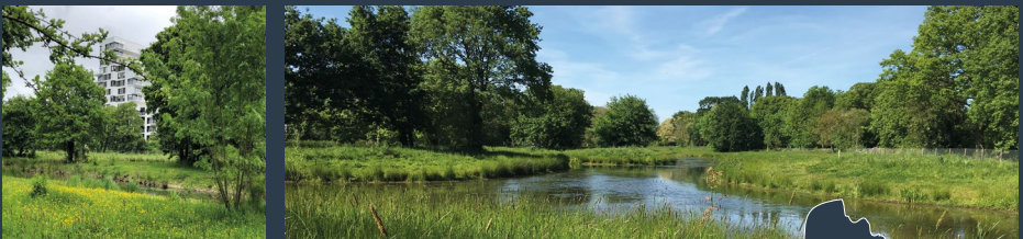
Reconversion de fonciers en friches - Les prairies Saint-Martin, Rennes (35)