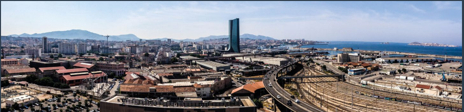
Smartseille - Prise de vue panoramique depuis la grue de la friche Allar reconvertie, Marseille (13)

De la stratégie au suivi des performances, EODD intervient en tant que conseil expert, bureau d’études, assistance à maîtrise d’ouvrage (AMO), maîtrise d’œuvre et ingénierie embarquée. Avec plus de 3000 missions références, 300 collaborateurs répartis dans 13 agences en France, EODD répond à l’ensemble de vos besoins dans toutes les dimensions de la transformation écologique.