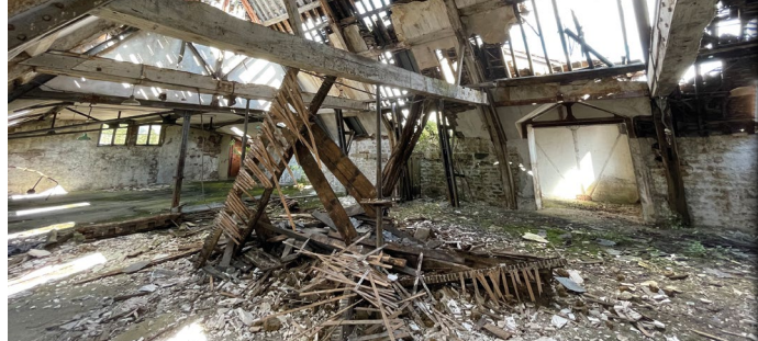
Friche de la filature Oudin, La-Ferté-sur-Chiers (08)

« Tout bien ou droit immobilier, bâti ou non bâti, inutilisé et dont l'état, la configuration, l'occupation totale ou partielle ne permet pas un réemploi sans un aménagement ou des travaux préalables ».